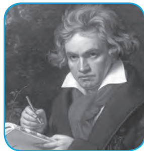
Lyudvig van Betxoven

Qadimda jangchilar jang oldidan nog'ora, karnay-surnaylar chalib ruhlantirilgan. Musiqa ohangi ularning qalbidida ona-Vatanga bo'lgan muhabbatni jo'sh urdirgan.