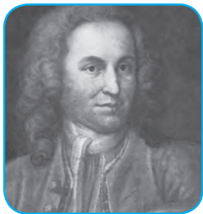
Iogann Sebastyan Bax