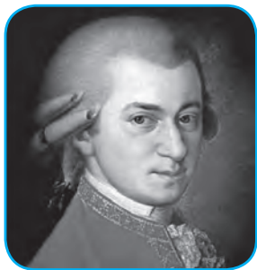
Volfgang Amadey Motsart