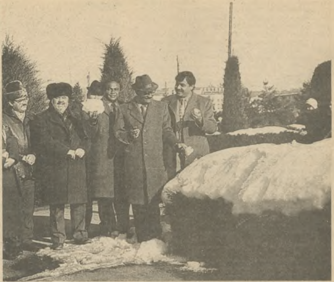
Бобурийзодалар Андижонда. 1993 йил

лари ҳали шоиримизга янгидан-янги бобуруна шеърӣ ҳайрат ва илҳом бағишлагусидир.