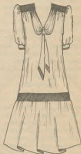
1 «Оила сабоқлари»дан.