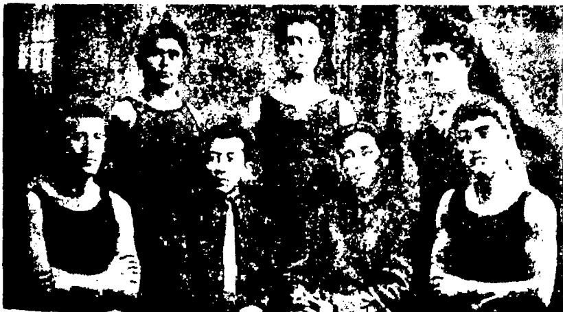
Москва кино студиясида ўқиган ўзбек йигитлари.

1927 йилда суратга олинган «Равот қашқирлари» фильми илиқ кутиб олинди. Фильмда С.Хўжаев ҳам маслаҳатчи, ҳам актёр бўлиб қатнашди 169 . Унинг муваффақиятига сабаб бўлган яна бир омил сифатида фильмга кўплаб фольклор намуналари ва 6 та халқ кўшиғи («Қари наво», «Собиржон», «Илғор», «Насруллоий», «Заркокил», «Дилрабо») оҳанглари-