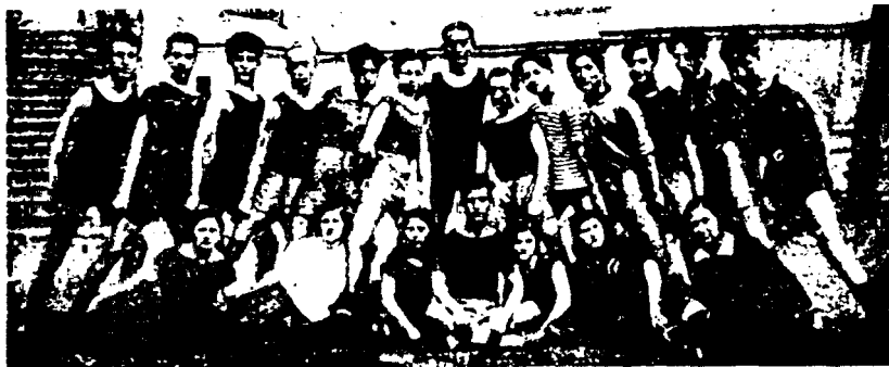
Москвада ташкил этилган ўзбек драма студияси ўқувчилари.

етиб бориши мумкин. Афсуски, бунга зид ўлароқ, маъмурий-буйруқбозлик тизими натижасида 1948 йили Консерваторияда миллий чолғу созлари кафедраси А.Петросянц раҳбарлигида иш бошлади ва миллий созларга эътибор қасддан кескин пасайтирилди. Бу раҳбар баъзи қадимий халқ чолғу созларини истеъмолдан олиб ташлади, қолган миллий созлар ҳам европа нотасига мослаш баҳонасида қайта ишланди, айримларининг тузилиши ўзгартирилди. Натижада миллий чолғу созлари ижрочилиги бўйича кадрлар тайёрлаш соҳасида ҳам маълум маънода инқироз юз берди. Муҳиддин қори Ёқубов каби миллий санъат жонкуярлари эса 1952 йилги сталин қатағонининг иккинчи тўлқинидан қутула олмади 94 . 1950 йиллардан европа мусиқасига сажда қилиш авж олдирилиб, ҳатто ўша пайтда Ўзбекистоннинг давлат раҳбари бўлган У.Юсупов ҳам миллий созлар тарафдори деган айблов билан жиддий танқид қилинди ва унинг фаолиятини текшириш бўйича махсус комиссия тузилди 95 .