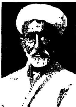
Мулла Тўйчи Тошмухаммедов

1905 йилда Мулла Тўйчи Тошмухаммедов (1868-1943) Москва ва Рига шаҳарларига сафар қилган, ўшанда унинг ижросида «Илғор», «Янги Курд», «Эшвой», «Суворо» каби 20 дан ортиқ кўшиқлар Шарқ мусиқаси шинавандалари томонидан граммофон пластинкаларига ёзиб олиниб тарқатилганди 11 . Шундан сўнг Мулла Тўйчининг хизматлари ўлароқ Туркистоннинг бир қанча шаҳарларида ҳам граммофон пластинкаларини сотадиган дўконлар ташкил этилди 12 .