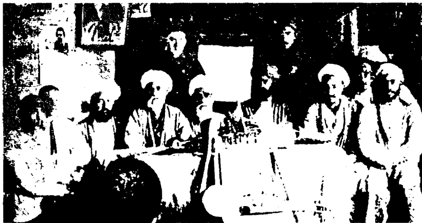
Бухоро Шарқ мусиқий мактаби ўқитувчилари (сўлдан):