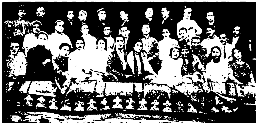
Биринчи ўзбек давлат академик труппаси.

да. Бу эса фақат артистларнинг эмас, ёзувчиларнинг ҳам халқ ҳаёти, турмуш маданияти, орзу-истакларидан нақадар узоқлигини англатади. Халқимиз ҳозирги даврда санъатни, айниқса, европа санъатини хоҳламайдир. Нима учун «Ҳалима» ва «Ёрқиной» машҳур бўлиб кетди. Ундаги халқ ҳаётидан олинган саҳналар, таниш қаҳрамонлар мухлисни саҳнага тортмоқда. Бугун Шекспир, Гоголь асарлари ҳам эмас, кўпроқ халқ учун хизмат қиладирган «Ўзбек халқ театрусини тузмоқ керак» 99 – деб қатъий фикр билдирган эди. Шундан сўнг матбуотда миллий асарлар яратиш масаласи кескин қўйилди.