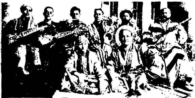
Биринчи туркология курултойида ўзбек санъаткорлари. Боку. 1926 йил.

ган қадимги, оҳангдор наволари билан бирга ҳозирги тирик куйларини ўзбекка махсус хусусият билан ғарблилар олдида ижро этди. Қори Ёқубнинг рафиқаси Тамарахонум ўзбек қизининг ўйноқилағон онларини (моментларини) бундан кўпрак ғамгин, ҳасратлик кунларини маънодор рақслар билан гавдалантирди. Муҳиддин Қори ва Тамарахонимларнинг қишлоқ йигитлари билан қизларининг лапар айтишиб, ўйнашиб юрганларини кўрсатишлари ҳар куни янги бир завқ истаган Парижликларда бошқача шавқ уйғотди. Қишлоқларимиздаги ишқнинг қанчалик табиий ва чиройлик экани уларга ёқди. Ашулачиларимиз олқишлар орасида саҳнада қайта-қайта кўрилмакка мажбур бўлдилар.