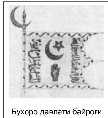
Бухоро давлати байроғи

Бухоро амири қанчадан-қанча минг бош отни Русия давлатига берди. Ҳар хил фаслларда тоғу чаманзорлар ранг-баранг бўлганидан қўй, эчки, от ва туя сурувлари ўз ўтлоқларида