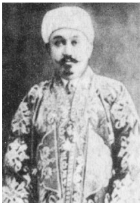
Генерал Ҳожи Юсуфбек

қилиб, ўз ишидан бизни огоҳлантириб турарди. Шунда бу бандайи ожиз ислом йўлидаги мужоҳидлар учун юқори мансаблар, даража ва шонларини кўтариш учун муҳрим ва имзом билан буйруқ юборардим. Ҳар гал ҳол сўраш учун ўз тарафимдан Қобул доруссалтанасидан бир — икки нафар одам юбориб холидан хабар олардим. Шундай қилардимки, менинг тарафимдан борганлар ҳол-аҳвол сўрашиб, қайтиб келишарди; Иброҳимбек ҳам ўз ишини ҳеч маҳал менинг ижозатимсиз қилмасди. Шу аснода Иброҳимбек Ҳисор вилоятини ўраб олган бўлади. Бухоройи шариф тарафидан турк Анвар пошшо 23 йигирма етти нафар турклар билан Бухоронинг шарқ тарафидан Қўрғонтепа вилоятида мужоҳид аскарларига яқин келади. Шунда мазкур аскарлар Анвар пошшонинг бу келиши кайфиятини мулло Иброҳимбекка хабар беришибди. Шу билан бу лашкарбошимиз 24 бу маънодаги гапни бу бандага хабар қилади. Аҳволга кўра қандай сиёсат юргизишни у менинг фикр-мулоҳазамга ташлайди. У кайфиятни, доно бир тадбир ишлатиш йўлини ва хусусан мусулмонлар халифаси бўлмиш Султон Рашидхон 25