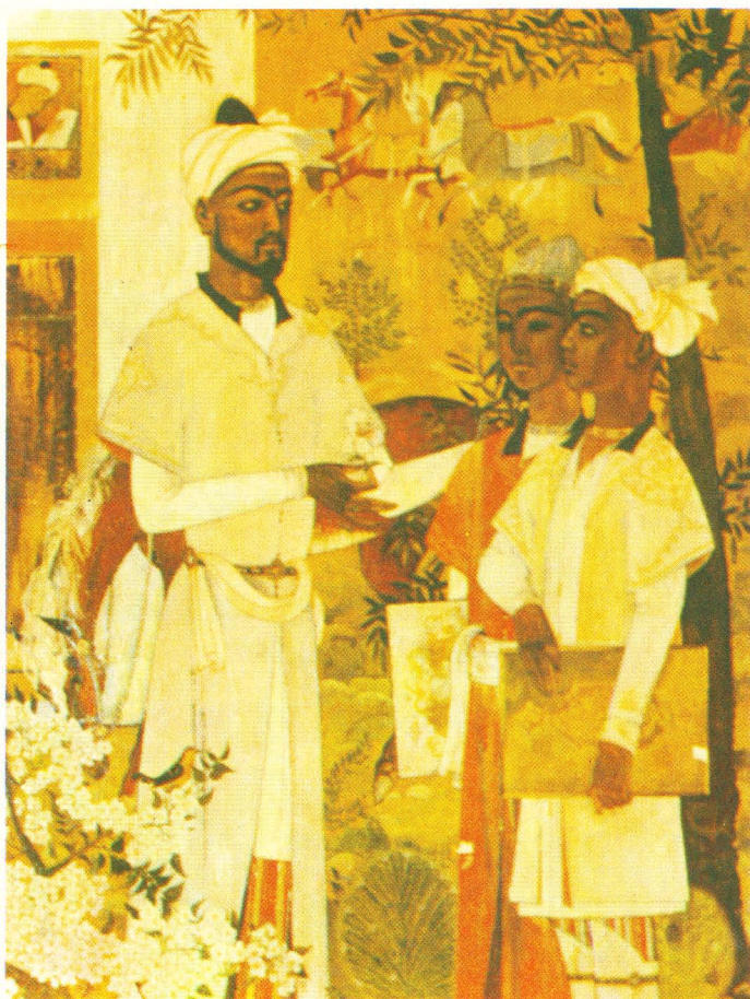
Камолиддин Беҳзод ўз устози Мирак Наққош ҳузурида. Рассом Жавлон Умарбеков.

Моҳир наққош ва миниатюра устаси Камолиддин Беҳзод 1537 йил (942 ҳижрий)-да вафот этди.