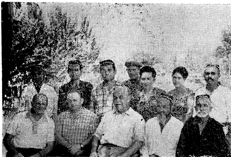
Катта Фарғона канали хизматчиларининг бир гуруҳи. 1964 йил.

Коммунистик партия ва Совет ҳукумати СССРда пахта мустақиллигини таъминлаш вазифасига катта эътибор берди. Ўзбекистон асосий пахтакор район бўлиб, мамлакатда пахта мустақиллигини таъминлашда асосий роль ўйнаши керак эди. РКП(б) Марказий Комитетининг СССРда пахтачиликни ривожлантириш