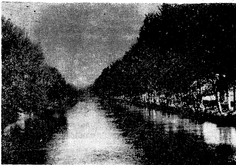
Халқ жасоратининг абадий тимсоли бўлиб қолган мўъжиза мана шу канал!

жалигининг бошлиғи бўлди. Катта Фарғона каналида ишлади. Исфайрам-Шоҳимардонсой районлараро каналлар бошқармасига раҳбарлик қилди. Бошқарма коллективи Олтиариқ, Тошлоқ, Фарғона, Охунбобоев, Қува районлари ҳамда Қувасой шаҳри деҳқонларини оби-ҳаёт билан таъминлади. Сўнгги 20 йил ичида юзлаб километр янги каналлар қазилди. Унлаб замонавий гидроиншоотлар қад кўтарди. Фойдаланишга топширилган Полмон гидроузели бошқарма коллективининг фахри бўлиб қолди. Яқин ўтмишда кичикроқ сойнинг сувини тўсиб далаларга оқизиш учун 30—40 митроб сепоя ташларди. Бугунга келиб бу вазифани бир киши удалайди. Полмон гидроузелидан секундига 250 кубметр сув ўтади. Улкан оқимни навбатчи диспетчер бошқариш пульти ёрдамида жиловлайди.