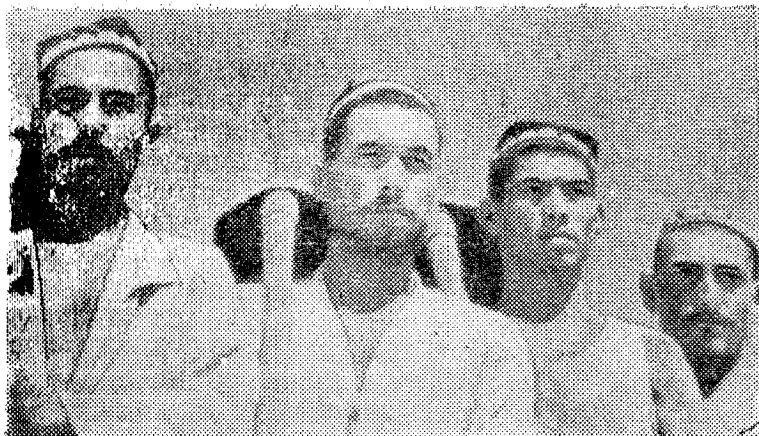
Халқ жасоратга отланди. 1939 йил.

Секундига 1200 кубометр сув ўтказа оладиган Фарғона усулидаги Куйганёр тўғони қурилди. Норин дарёси бетонлаштирилди. 98 кубометр сув сарфлаш қувватига эга бўлган бош иншоот тақсимлагич ишга тушди. Умуман каналда 42 200 кубометр бетон ва темирбетон ишлари бажарилди. 25 000 кубометр ёғоч материаллари сарфланди. 1106 тонналик металл-конструкциялар ўрнатилди. 45 та йирик, 275 та кичик ҳажмли иншоотлар ишга солинди. 101 жойда сув ўтказиш дюкерлари, 118 акведуклар, 6 темирўл ва 7 та кўркам кўприк қурилди. Канал бўйларида 69 бино қад кўтарди. Канал четларини мустаҳкамлаш, кўкаламзорлаштириш, боғ-роғлар барпо қилишга киришилди.