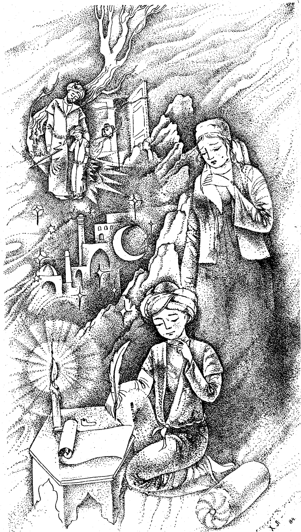
Рассом Х. Лутфуллаев