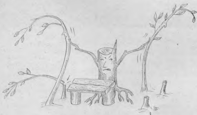
Изоҳнинг ҳожати йўқ.

Қалбимизда не ният Аён ё ноаёндинр, Жилмаювчи мулойим, Беозор одамлармиз.