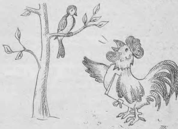
Жўжаҳўроз: Диссертацияни учиш ҳақида ёзганман, лекин учшимга ҳеч имкон беришмаяпти.