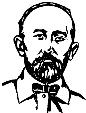
Абдулла Авлоний (1878—1934)

Абдулла Авлоний улкан ўзбек шоири, драматурги ва таникли жамоат арбобидир.